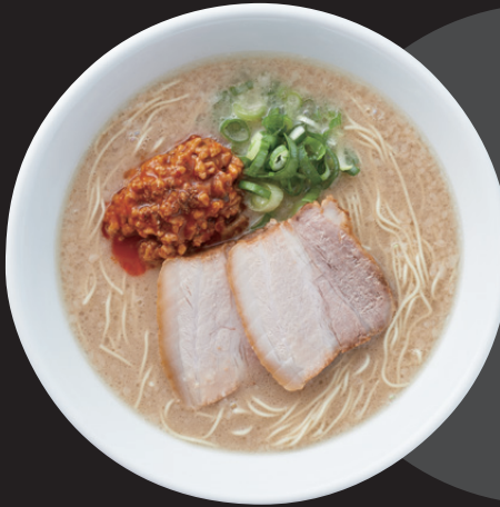
シロマルベース ¥700 SHIROMARU BASE

数種の香辛料を 配合したピリ辛肉味噌を トッピング。 スパイシーな風味と豚骨 のコクがマッチ!